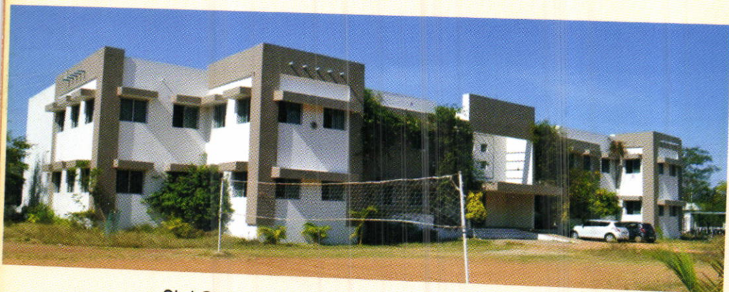
Shri Govindrao Munghate Arts & Science College, Kurkheda, Dist. Gadchiroli